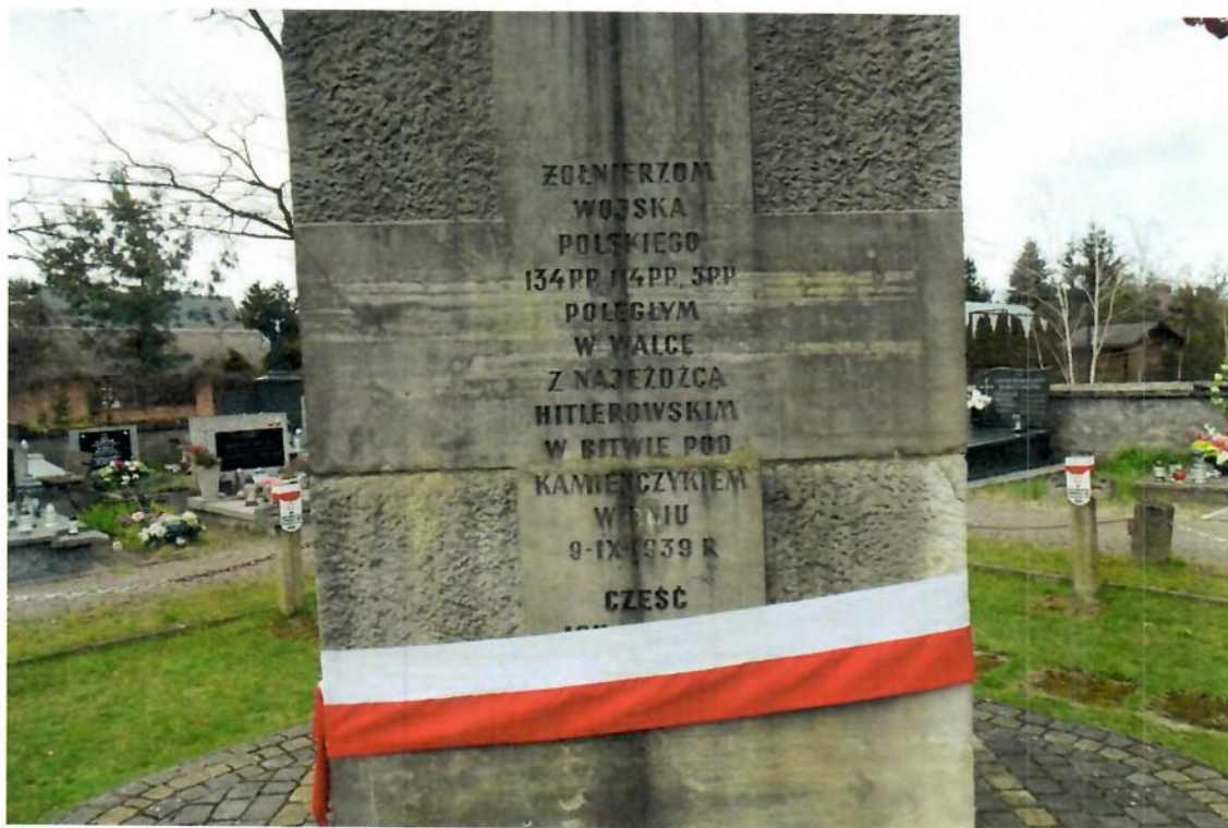
Fot. Waldemar Brzostek kwiecień 2025 r. (obelisk z piaskowca-fronton)