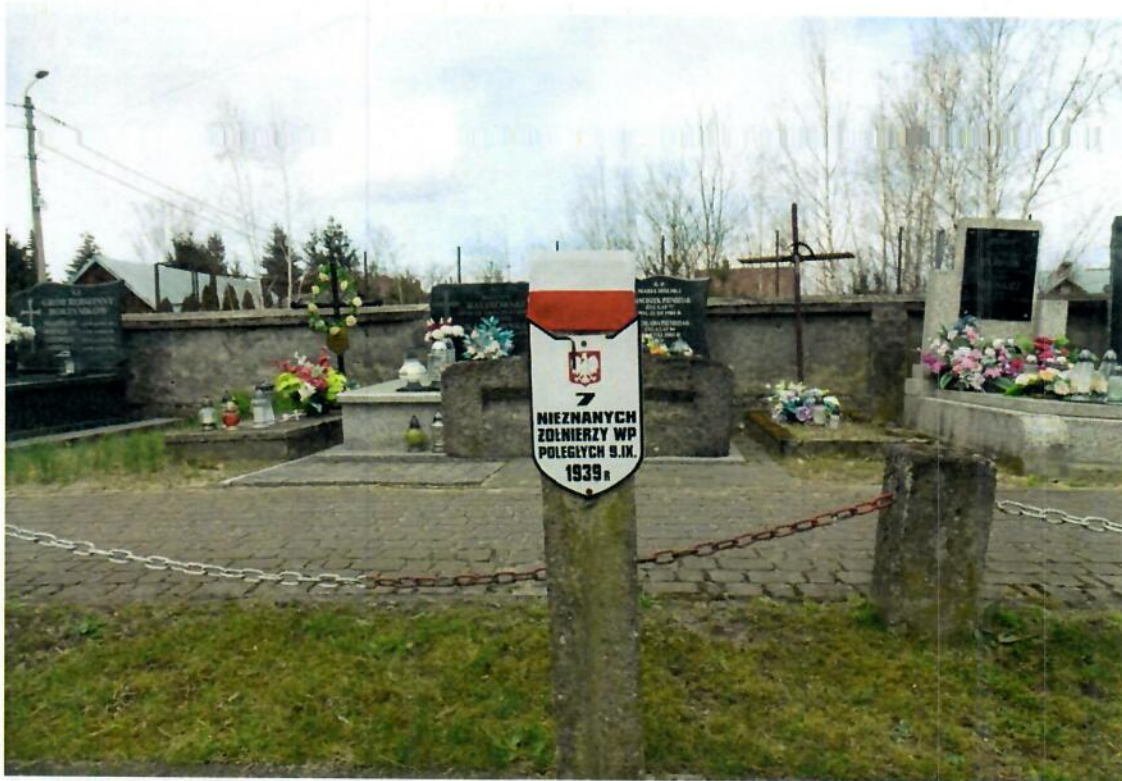
kwiecień 2025 r. (krzyż betonowy)