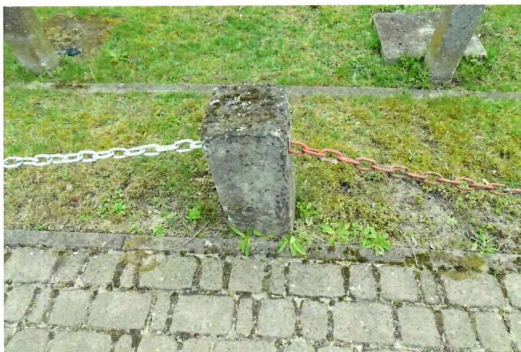
Fot. Waldemar Brzostek kwiecień 2025 r. (słupki ogrodzeniowe z elementami metalowymi)