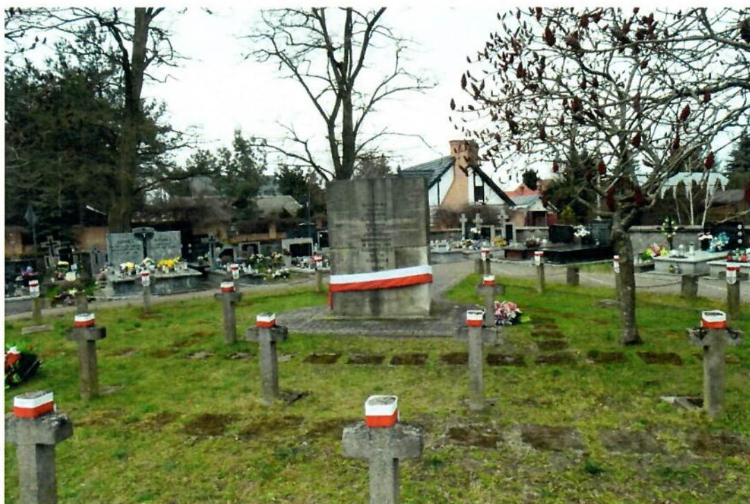
kwiecień 2025 r. (widok miejsca pamięci)

Tablica pamiątkowa i groby 300 żołnierzy Wojska Polskiego poległych we wrześniu 1939 roku. Podczas kampanii wrześniowej okolic Wyszkowa broniły oddziały GO „Wyszków” gen. bryg. Wincentego Kowalskiego, których zadaniem było opóźnianie marszu wojsk niemieckich z północy na Warszawę. Na skutek silnego naporu nieprzyjaciela i ciężkich bombardowań 8 września 1939 r. Polacy wysadzili mosty w Wyszkanie i wycofali się na południowy brzeg Bugu celem otwarcia nowej linii obrony.