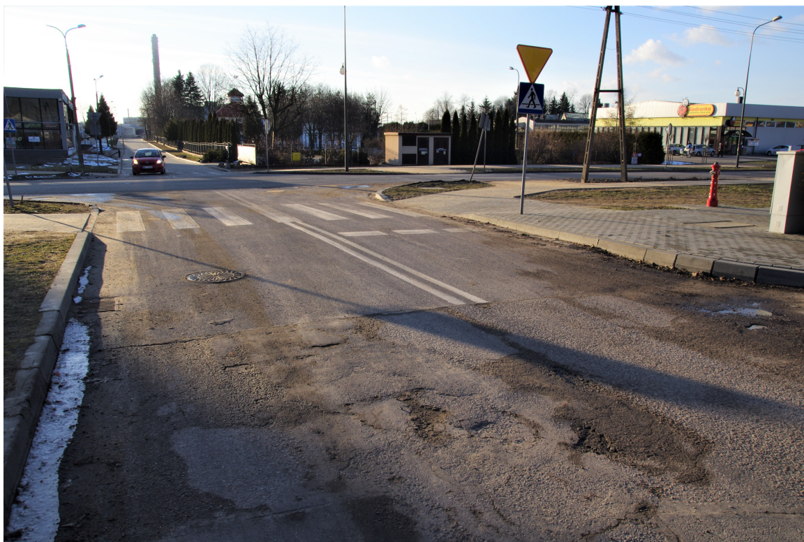
Ul. Komunalna. Stan istniejący (skrzyżowanie z ul. IAWP – początek robót remontowych).

W pasie drogowym zlokalizowane są następujące sieci uzbrojenia terenu: