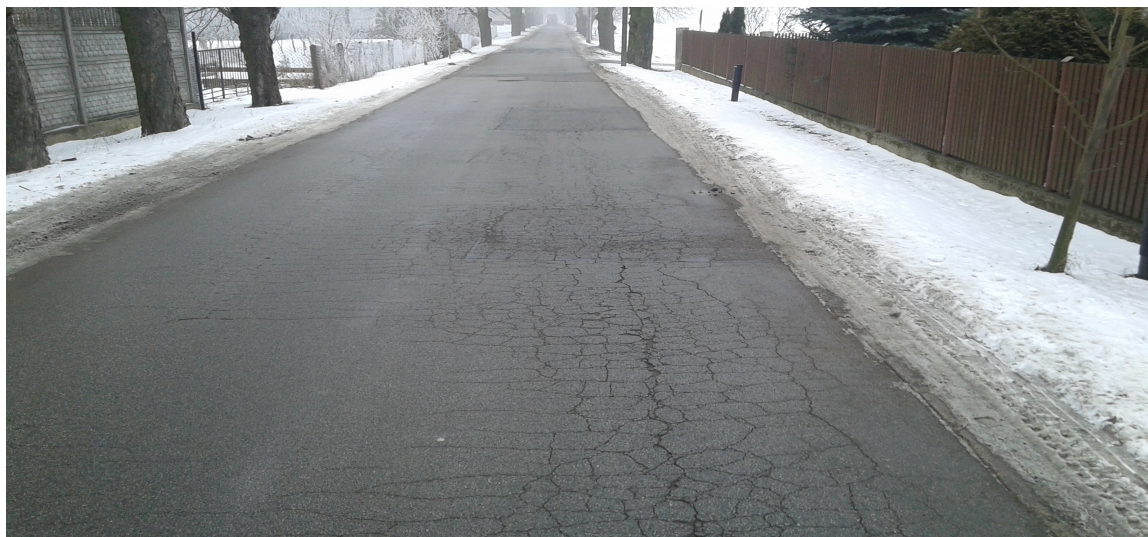
Ul. Kasztanowa. Pęknięcia siatkowe.