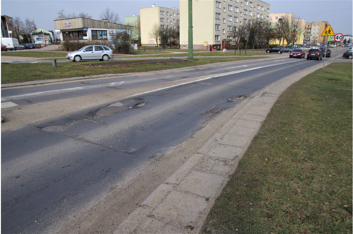
Al. J. Sowińskiego. Istniejące uszkodzenia nawierzchni.