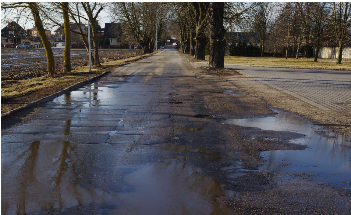
Ul. Kasztanowa. Stan Istniejący.