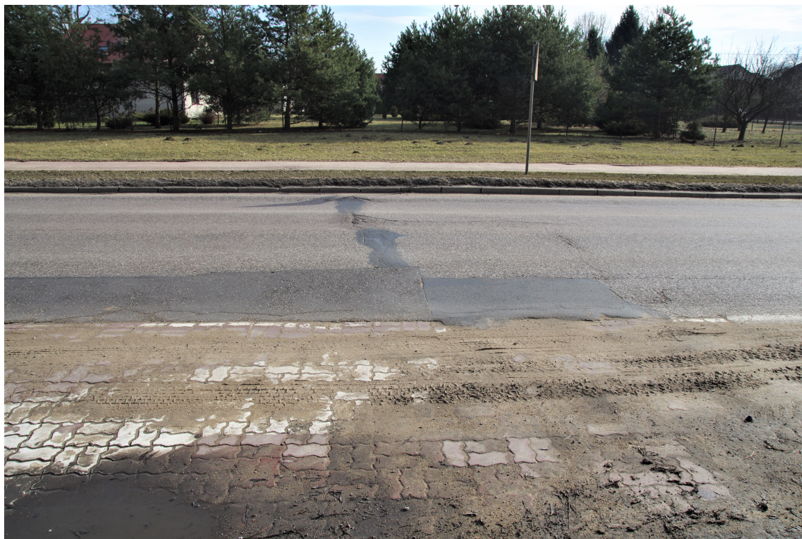
Al. J. Piłsudskiego. Istniejące deformacje trwałe nawierzchni oraz spękania poprzeczne.