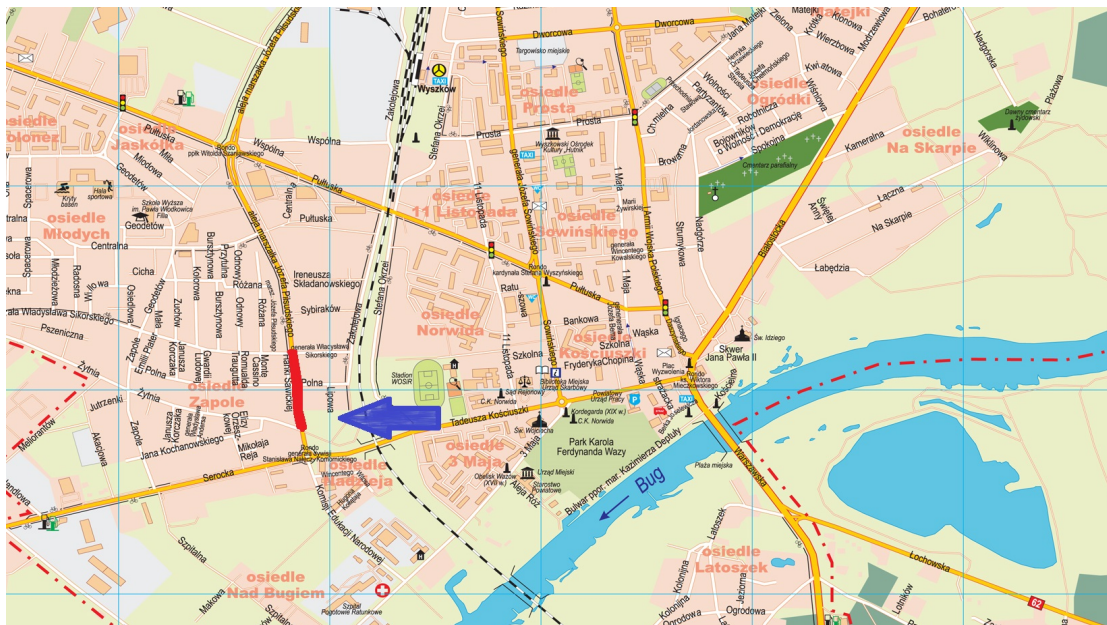
Plan orientacyjny. Lokalizacja odcinka al. J. Piłsudskiego zaznaczona kolorem czerwonym.

Al. Józefa Piłsudskiego jest drogą gminną. Pełni funkcję drogi zbiorczej, która stanowi część ciągu komunikacyjnego Śródmiejskiej Obwodnicy Wyszkowa. Jej łączna długość wynosi 873,5m m. Jest drogą jednojezdniową dwukierunkową. Nie narusza systemu wodnego i nie przebiega po terenach o charakterze zabytkowym.