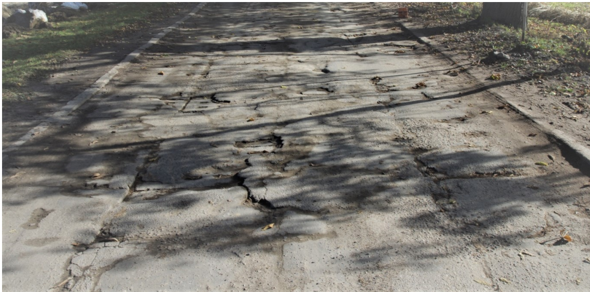
Ul. Kasztanowa. Spękania oraz ubytki.