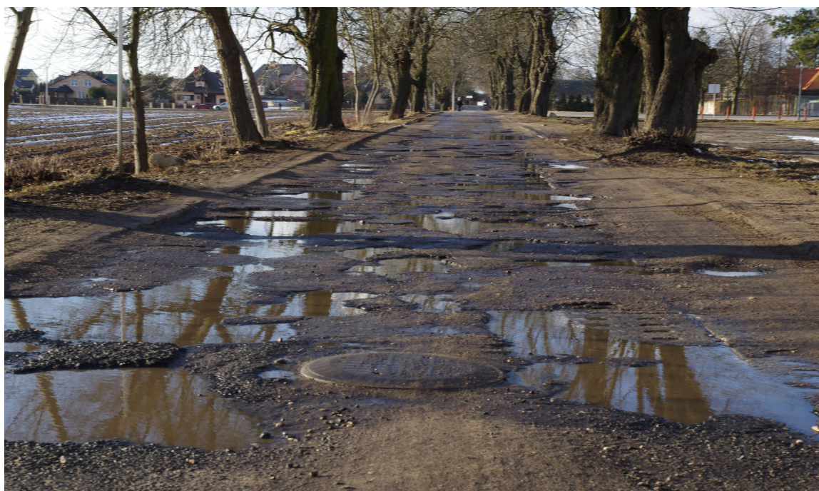
Ul. Kasztanowa. Ubytki w warstwie ścieralnej.

Cześć krawężników posiada wykruszenia i jest rozprofilowana. Nie występują załamania krawędzi ani wysadziny.