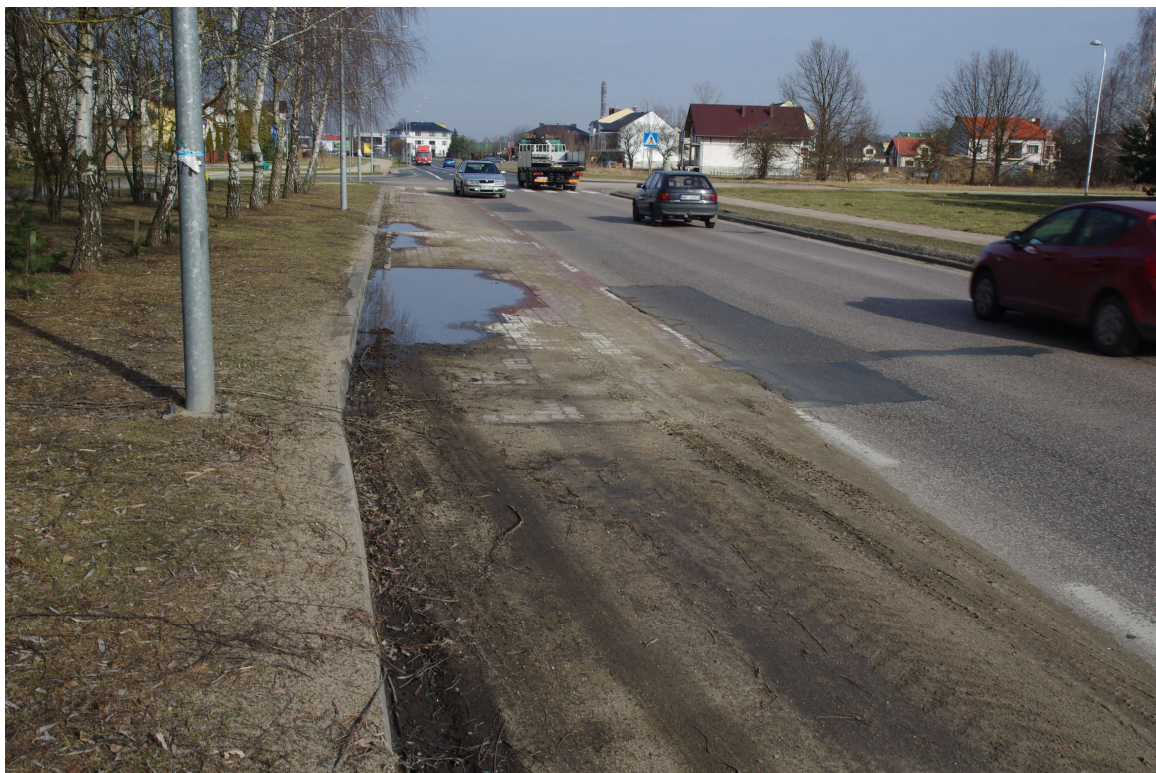
Al. J. Piłsudskiego. Stan istniejący.

W pasie drogowym zlokalizowane są następujące sieci uzbrojenia terenu: