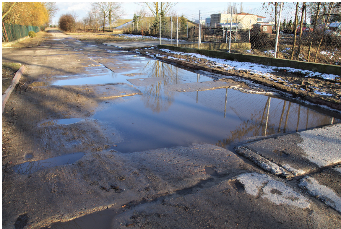
Ul. Komunalna. Załamanie płyt betonowych w wyniku utraty nośności podłoża.

Ogłędziny nawierzchni betonowej przeprowadzone zostały w porze suchej oraz deszczowej.