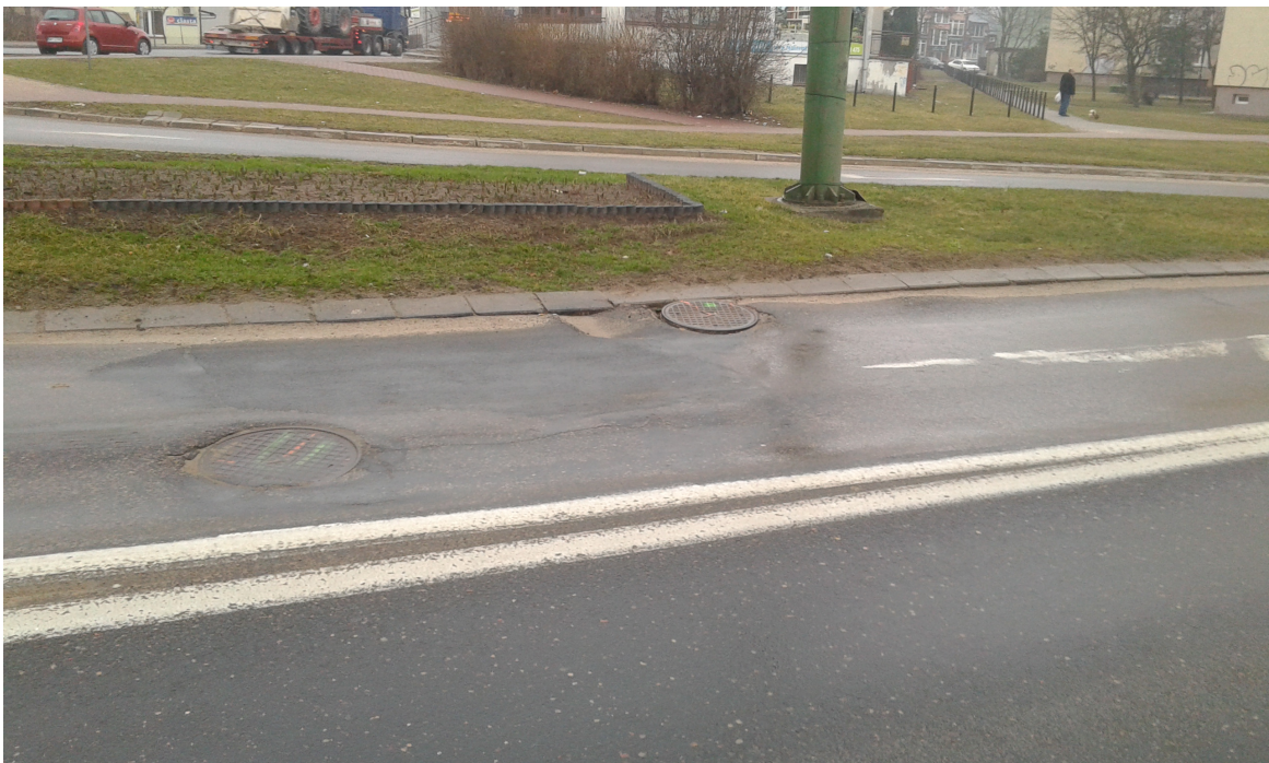
Ul. J. Sowińskiego. Istniejące deformacje trwałej nawierzchni.