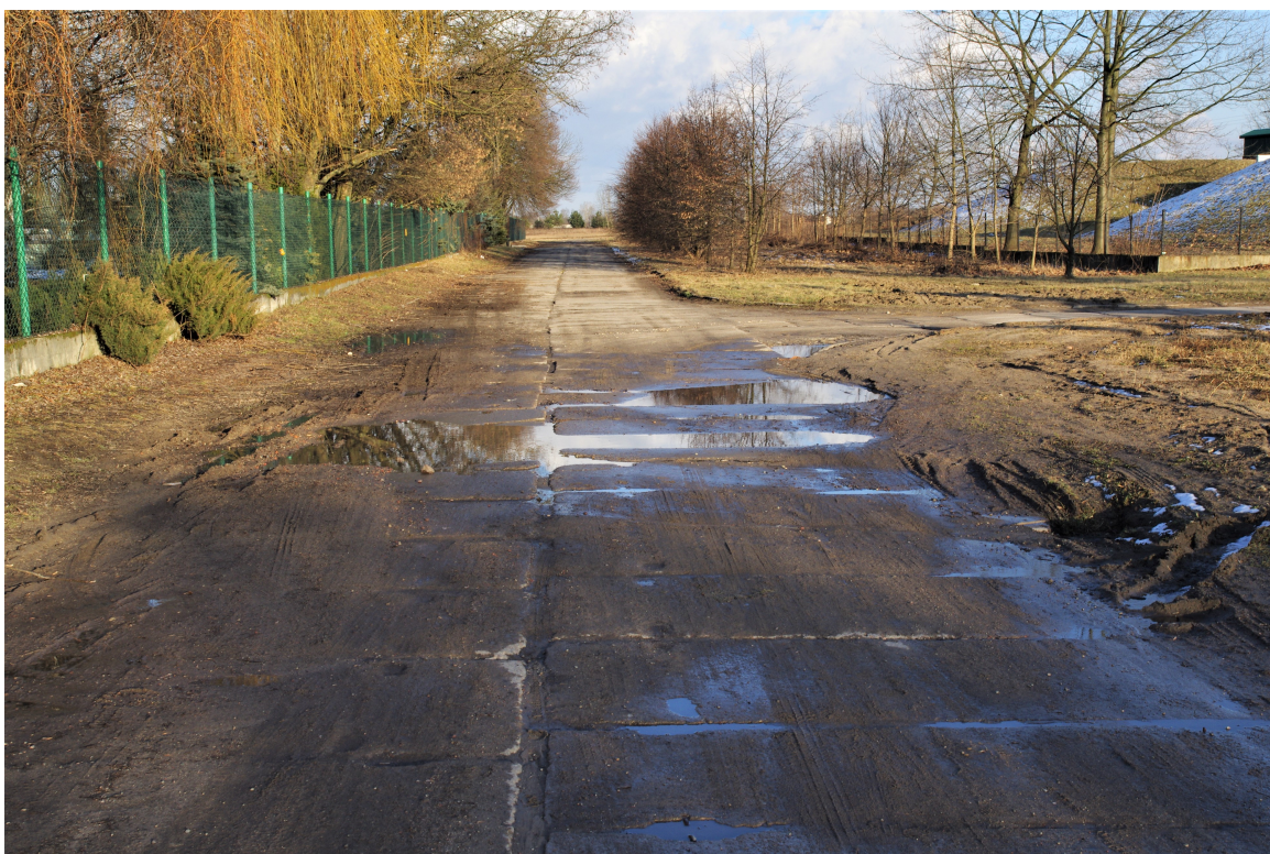
Ul. Komunalna. Przykład załamania płyt betonowych w wyniku utraty nośności podłoża.