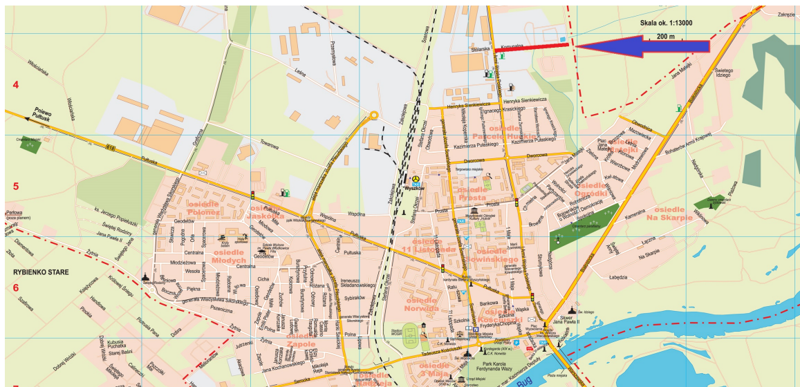
Plan orientacyjny. Lokalizacja odcinka ul. Komunalnej zaznaczona kolorem czerwonym.

numer drogi 440546W nazwa drogi Komunalna zarządca drogi Burmistrz Wyszkowa