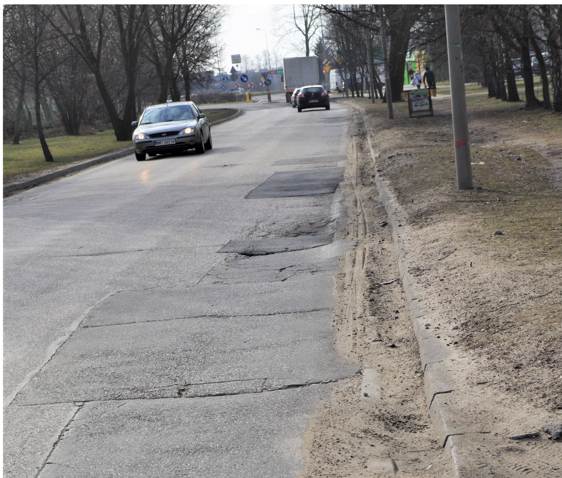
Al. J. Piłsudskiego. Istniejące uszkodzenia nawierzchni.

Wierzchnia warstwa posiada liczne nierówności oraz spękania ze znacznymi wykruszeniami i luźnymi kawałkami nawierzchni.