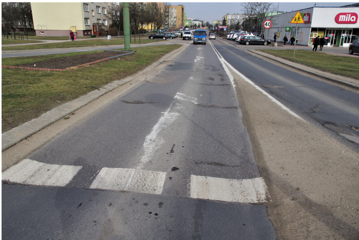
Ul. gen. J. Sowińskiego. Stan istniejący.