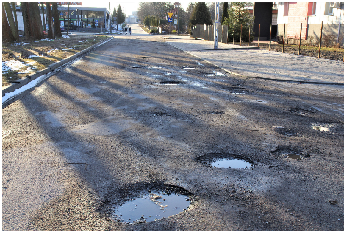
Ul. Komunalna. Wyboje, ubytki w nawierzchni bitumicznej.