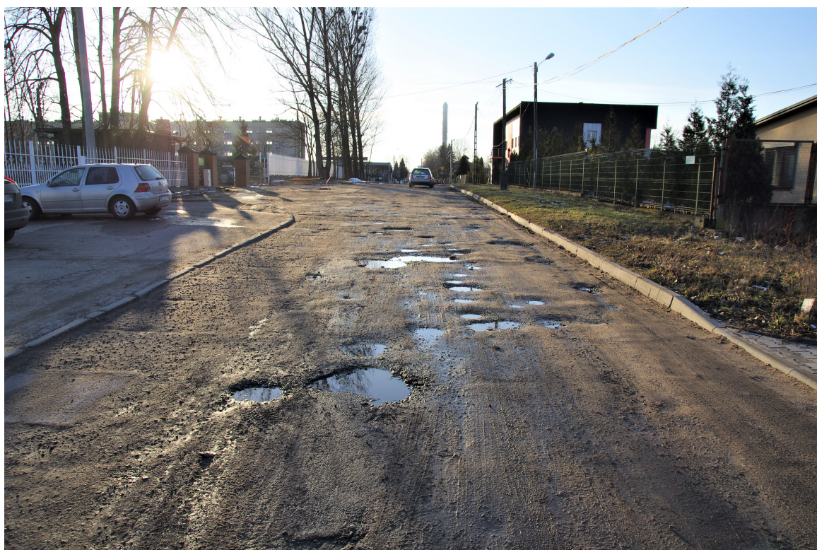
Ul. Komunalna. Wyboje, ubytki w nawierzchni bitumicznej.