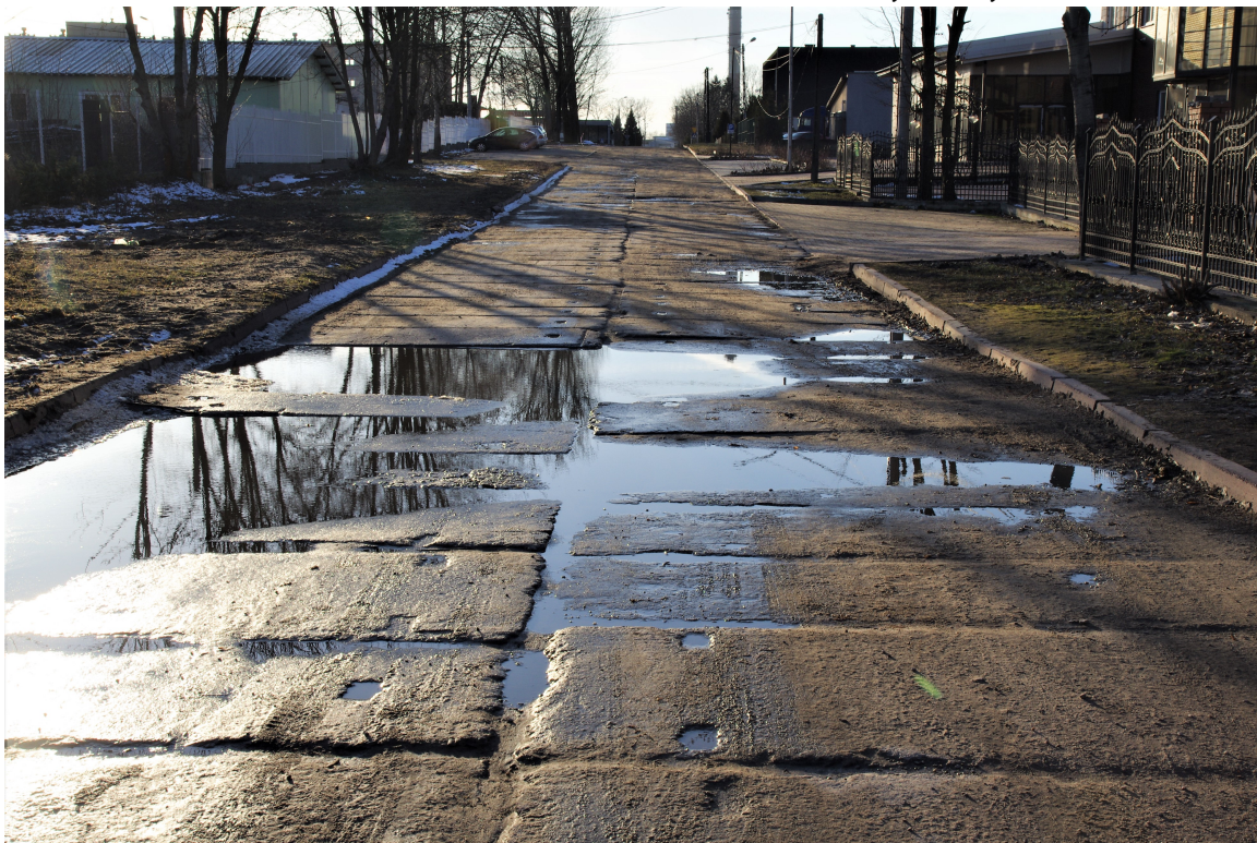
Ul. Komunalna. Przykład załamania płyt betonowych w wyniku utraty nośności podłoża.

Wykonanie nakładki bitumicznej na istniejącej podbudowie z płyt betonowych (odcinek od km 0+150 do 0+390,2) nie jest wskazane z uwagi na niedostateczną trwałość podbudowy oraz brak prawidłowego odprowadzenia wody z nawierzchni. Istniejąca podbudowa wymaga przeprowadzenia częściowej przebudowy z wykorzystaniem istniejących płyt w celu dostosowania jej parametrów do funkcji podbudowy zasadniczej pod przyszłe warstwy bitumiczne. Projekt przebudowy płyt nie jest objęty niniejszym opracowaniem.