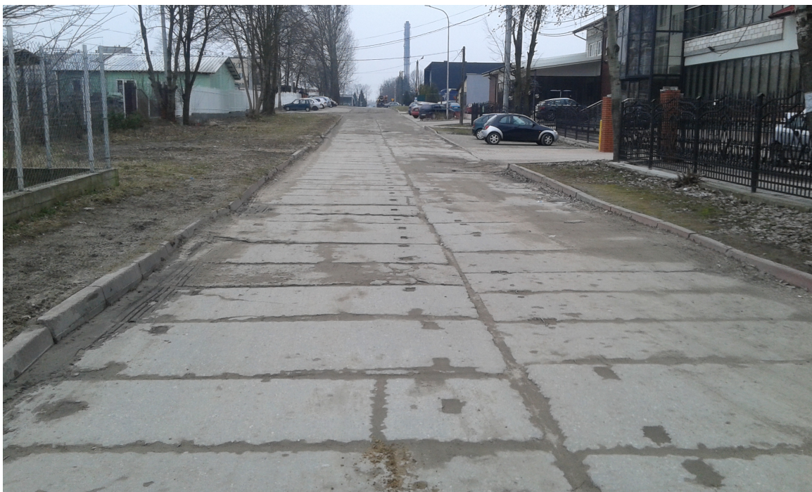
Ul. Komunalna. Istniejąca nawierzchnia z płyt typu MON.- zdjęcie w porze suchej.