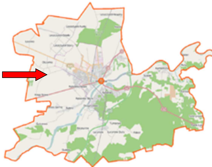
Mapa nr 2. Sitno w okolicach Wyszkowa