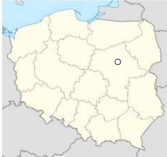
Mapa nr 1. Sitno na mapie Polski

Sitno to wieś, położona na północny – zachód od Wyszkowa, 65 km od Warszawy, w gminie Wyszków, powiecie wyszkowskim, województwie mazowieckim.