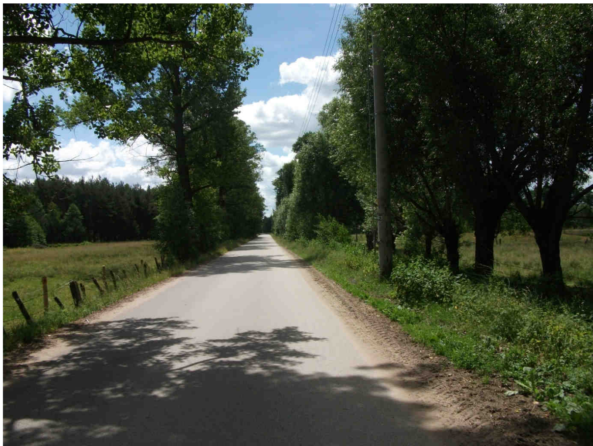
Zdjęcie nr 1. Miejsce, na którym przebiegać będzie oświetlenie

Przedmiotowe zadanie jest zgodne z Planem Zagospodarowania Przestrzennego Gminy Wyszaków. Obejmuje ono wykonanie oświetlenia w miejscowości Ślubów, na drodze komunikacyjnej i lokalnej. W celu wykonania przedmiotowej inwestycji wybudowana zostanie napowietrzna izolowana niskiego napięcia sieć elektroenergetyczna. W zakresie działań podjęty zostanie montaż i stawianie słupów wraz z podwieszeniem przewodu oświetlenia ulicznego oraz montaż opraw oświetlenia ulicznego wraz z wysięgami.