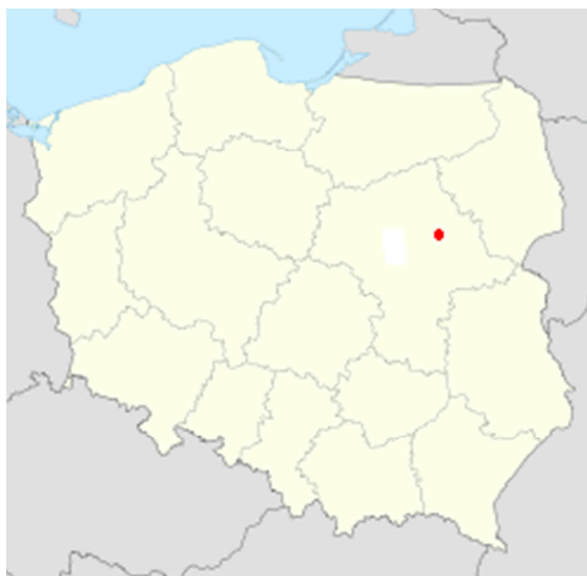
Mapa nr 3. Ślubów na mapie Polski

Ślubów to wieś, położona na południu od Wyszkowa. Jest to miejscowość znajdująca się około 57 km od Warszawy.