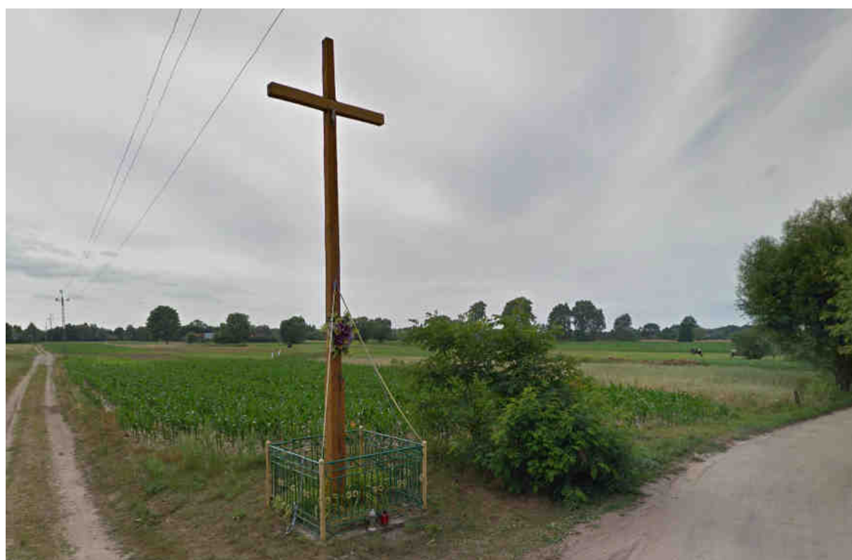
Zdjęcie nr 2. Kapliczka przydrożna, Ślubów.