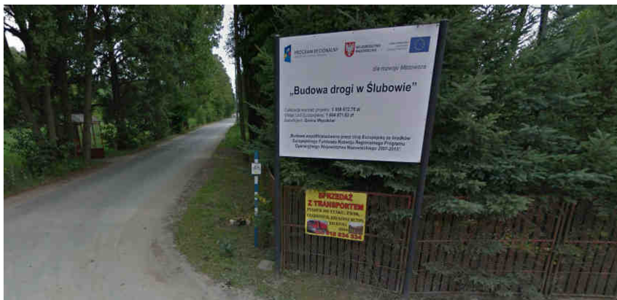
Zdjęcie nr 1. Ślubów