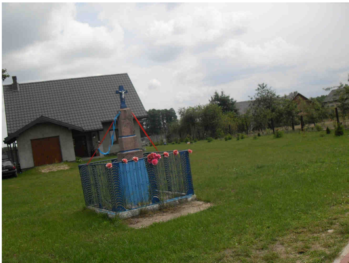
Zdjęcie nr 3. Kapliczka przydrożna, Łosinno.