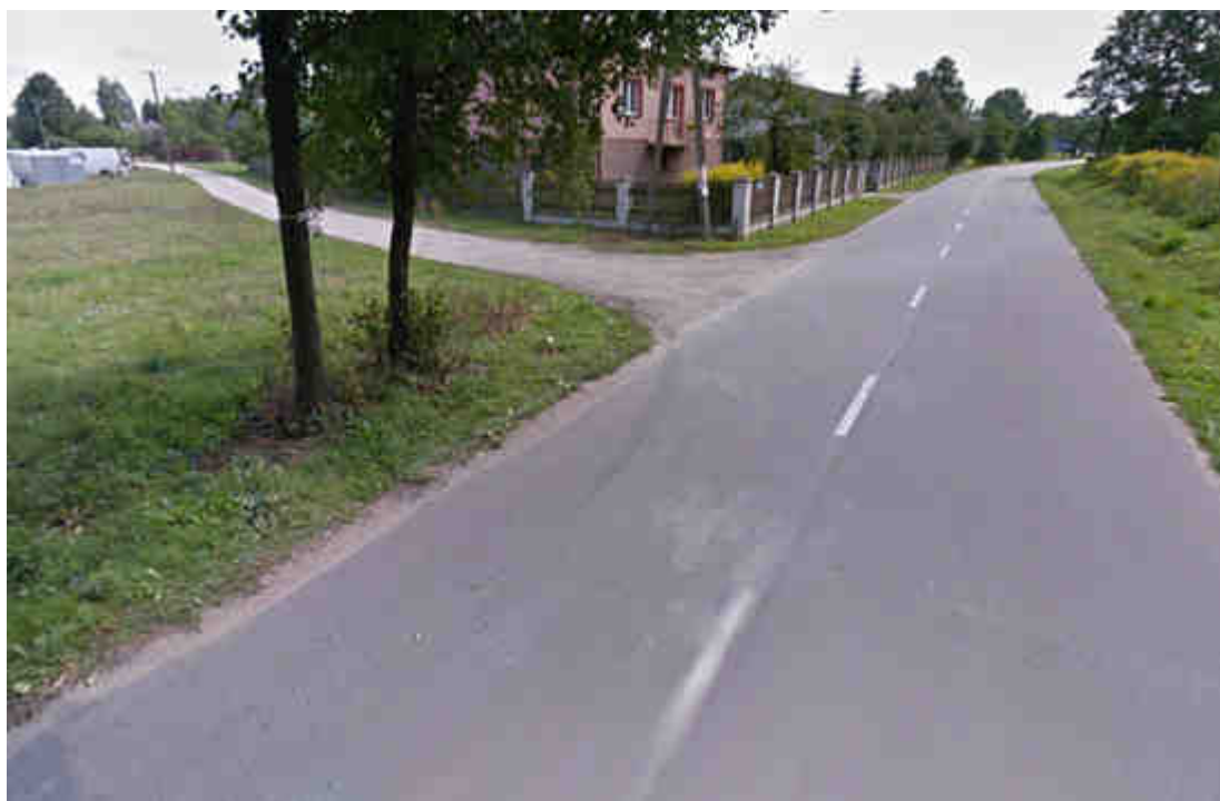
Zdjęcie nr 2. Ulica Centralna w miejscowości Łosinno.

Przedmiotowe zadanie jest zgodne z Planem Zagospodarowania Przestrzennego Gminy Wyszaków. Obejmuje ono budowę chodnika przy ulicy Centralnej w miejscowości