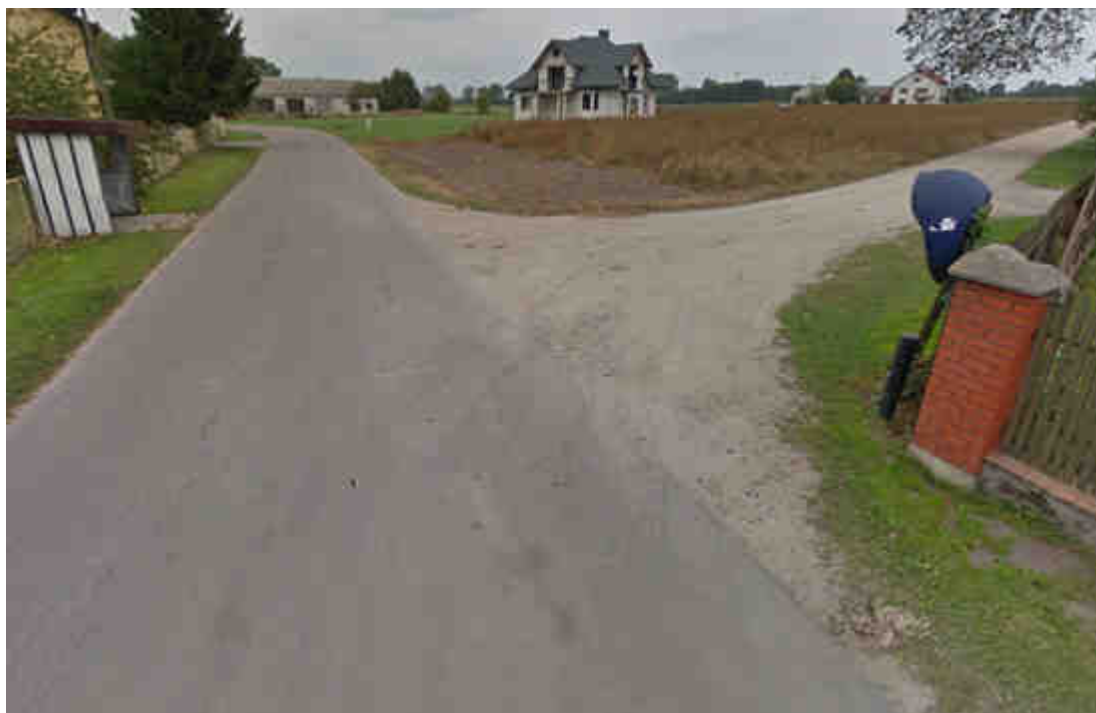
Zdjęcie nr 2. Ulica Szkolna w miejscowości Łosinno.