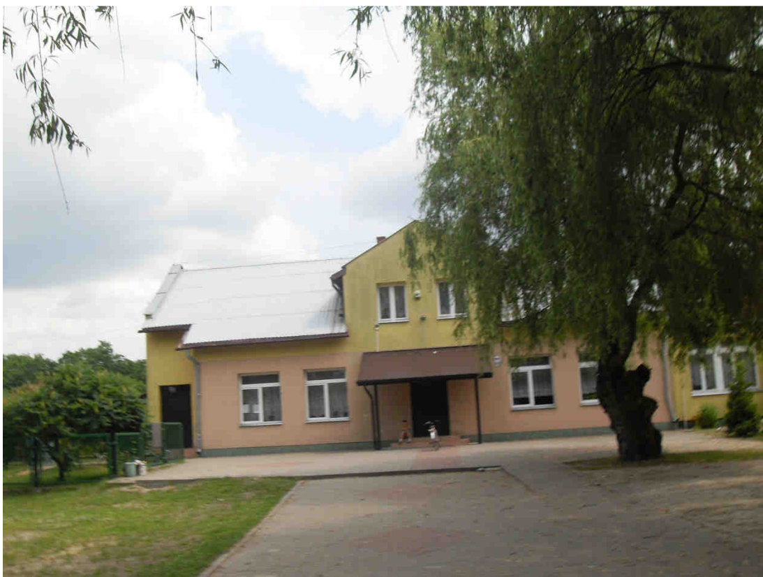
Zdjęcie nr 2. Szkoła Podstawowa, Łosinno