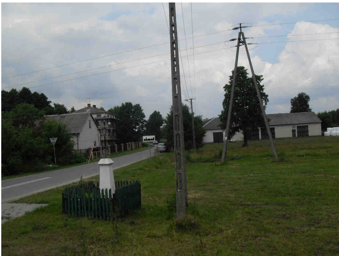
Zdjęcie nr 1. Łosinno