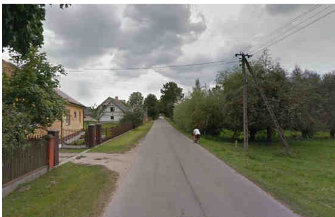
Zdjęcie nr 1. Ulica Szkolna w miejscowości Łosinno.

Zadaniem priorytetowym, przewidzianym do realizacji w ramach Europejskiego Funduszu Rolnego na Rzecz Rozwoju Obszarów Wiejskich: Europa inwestująca w obszary wiejskie jest „Poprawa jakości życia mieszkańców wsi Łosinno, poprzez budowę chodnika przy ul. Centralnej, gm. Wyszaków” która będzie polegała na zagospodarowaniu przestrzeni publicznej w miejscowości Łosinno (zdjęcie poniżej).