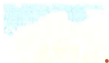
Mapa nr 1. Leszczydół Nowiny na Mapie Polski

Jest to dynamicznie rozwijająca się miejscowość, położona przy drodze powiatowej nr 4408W Wyszaków - Porządzie –Długosiodło. Wieś ma dobre połączenie drogowe i kolejowe - przechodzi przez nią linia kolejowa relacji Tłuszcz – Ostrołęka.