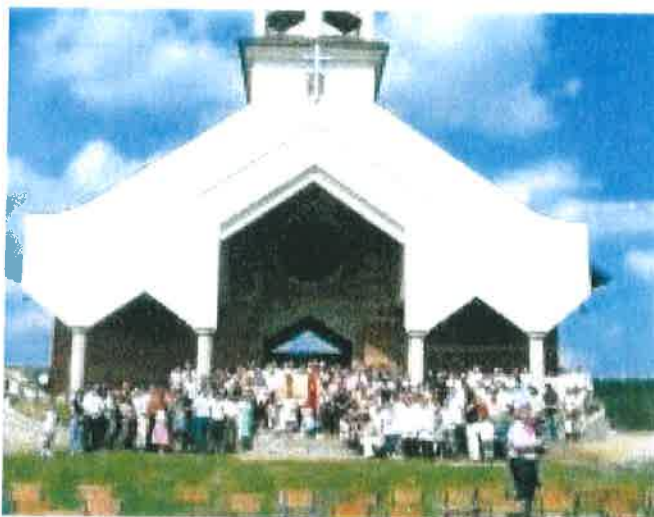
Zdjęcie: Kościół w Leszcydole Nowinach

Warto podkreślić, że miejscowa społeczność jest dobrze zorganizowana - od lat ma swojego przedstawiciela w Radzie Gminy.