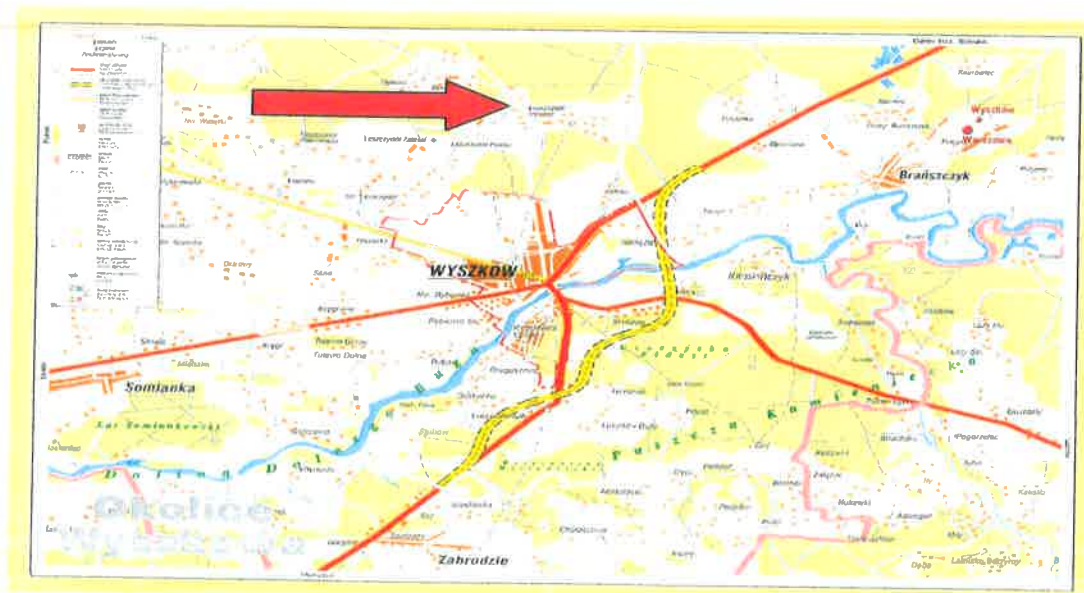
Mapa nr 2. Leszczydół Nowiny, a Wyszaków