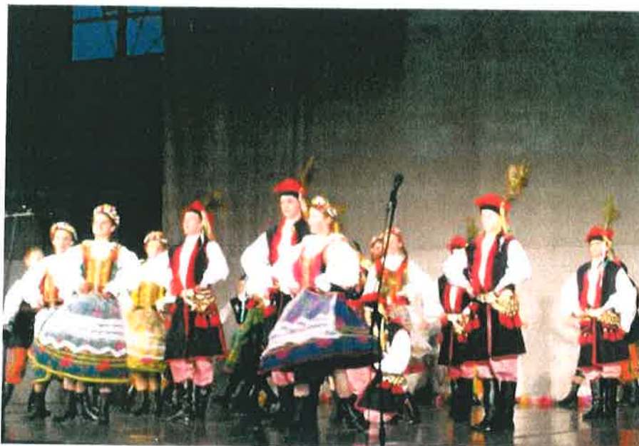
Zdjęcie: Zespół Pieśni i Tańca Wyszków

i przygotowują nowe układy taneczne. W okresie wakacyjnym zespół wyjeżdża na koncerty i festiwale zagraniczne.