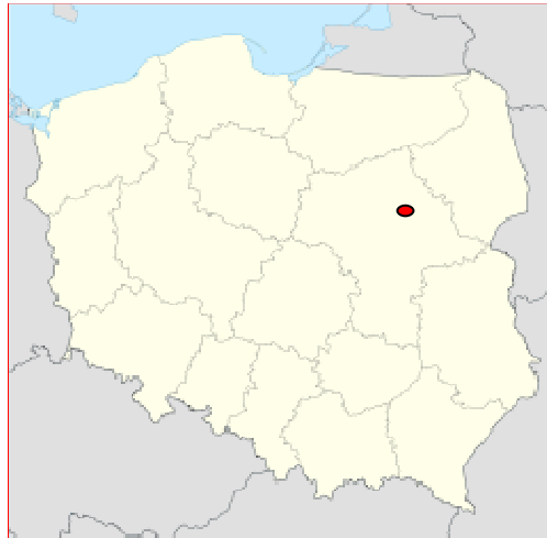
Mapa nr 1. Rybieno Nowe na mapie Polski

Rybienko Nowe jest niedużą wsią położoną w województwie mazowieckim, powiecie wyszkowskim, gminie Wyszaków, na zachód i w bezpośrednim sąsiedztwie Wyszkowa. Obszar wsi na mapie ma kształt księżycy „przytulonego” do terenów Wyszkowa. Wieś dzieli droga krajowa nr 62 Strzelno – Drohiczyn.