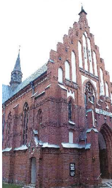
Zdjęcie 1. Kościół p.w. Wniebowzięcia Najświętszej Marii Panny w Kamieńczyk.

z 1901 r. Parafia pieczętuje się metalowym stemplem z 1774 roku. Przetrwwały niektóre akta metryczne z 1621 roku.