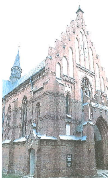
Zdjęcie 1. Kościół p.w. Wniebowzięcia Najświętszej Marii Panny w Kamieńczuku.

z 1901 r. Parafia pieczętuje się metalowym stemplem z 1774 roku. Przetrzywały niektóre akta metryczne z 1621 roku.