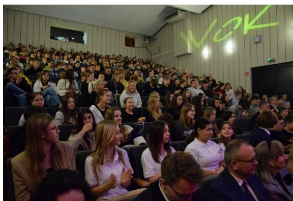
12. Zbiórka charytatywna dla mieszkańców Domu Pomocy Społecznej w Brańszczyku po nawiązaniu współpracy ze Starostwem Powiatowym w Wyszowie.