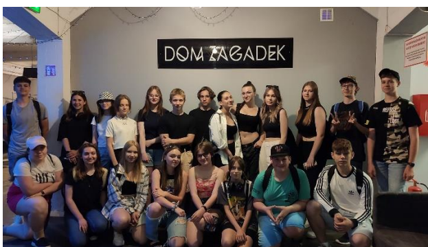
7. Gra Miejska we współpracy z Chorągwią Mazowiecką Związku Harcerstwa Polskiego w Wyszkanie (150 uczestników) – koszt 502,13 zł.