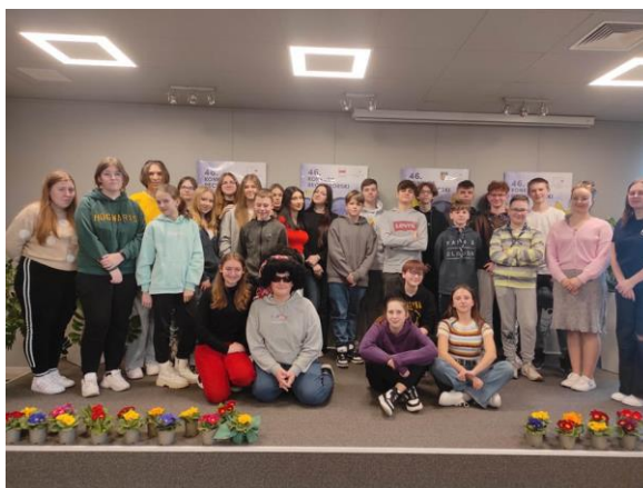
8. 11 urodziny MTP Farsa (250 uczestników) – koszt 4.589,30 zł.