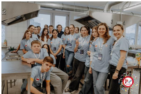
14. Wigilia (350 uczestników) – koszt 12.500,00 zł.