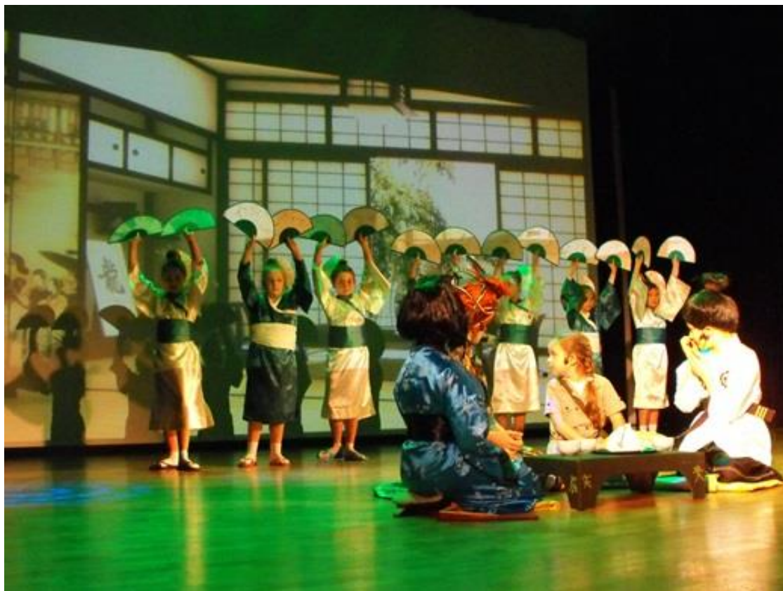
Spektakl w wykonaniu szkolnego koła teatralnego SP Nr 1