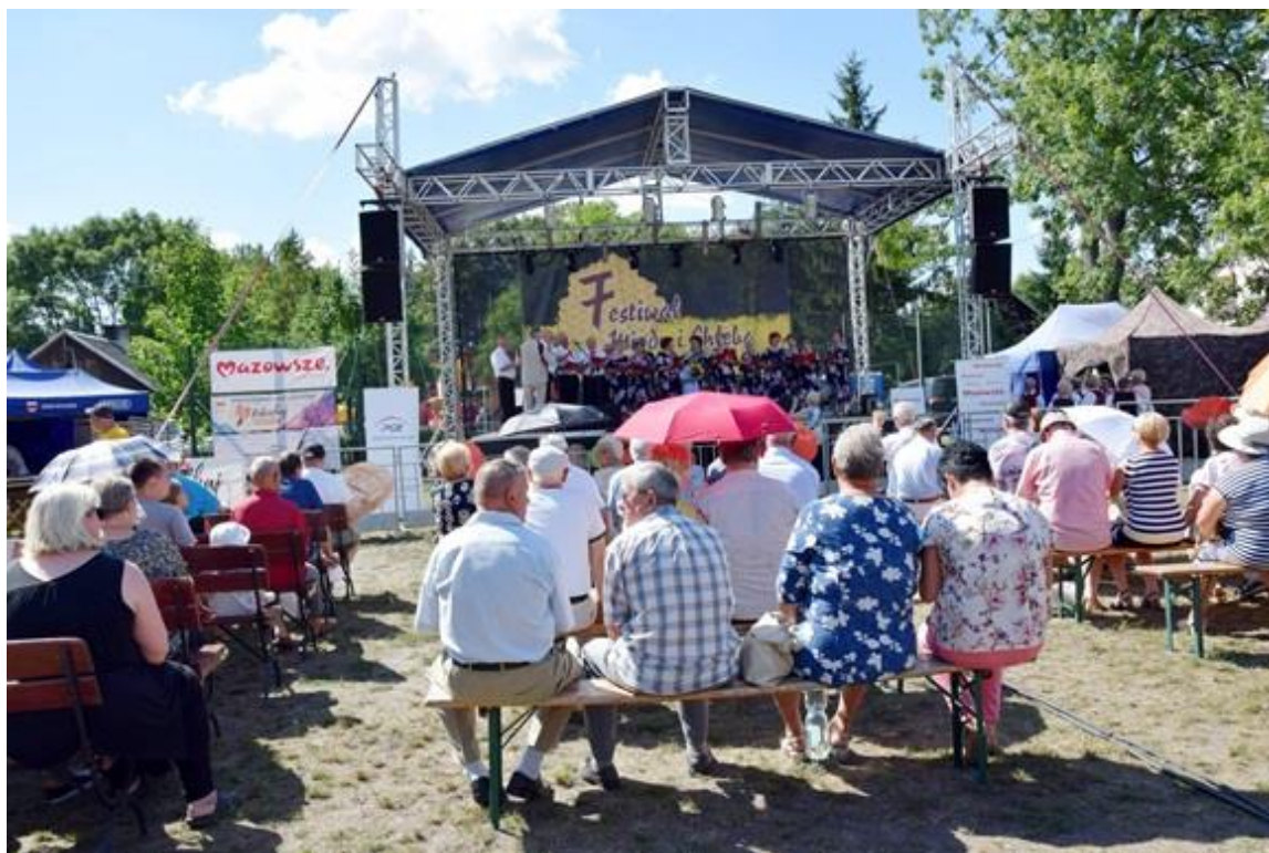
Festiwal Miodu i Chleba w Kamieńczyku