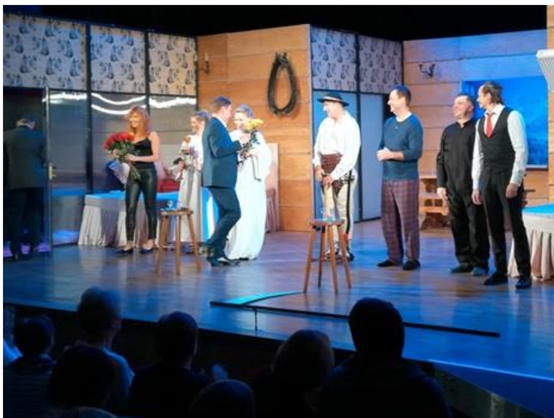
Teatr Kamienica „SPA czyli Salon Ponętnych Alternatyw”