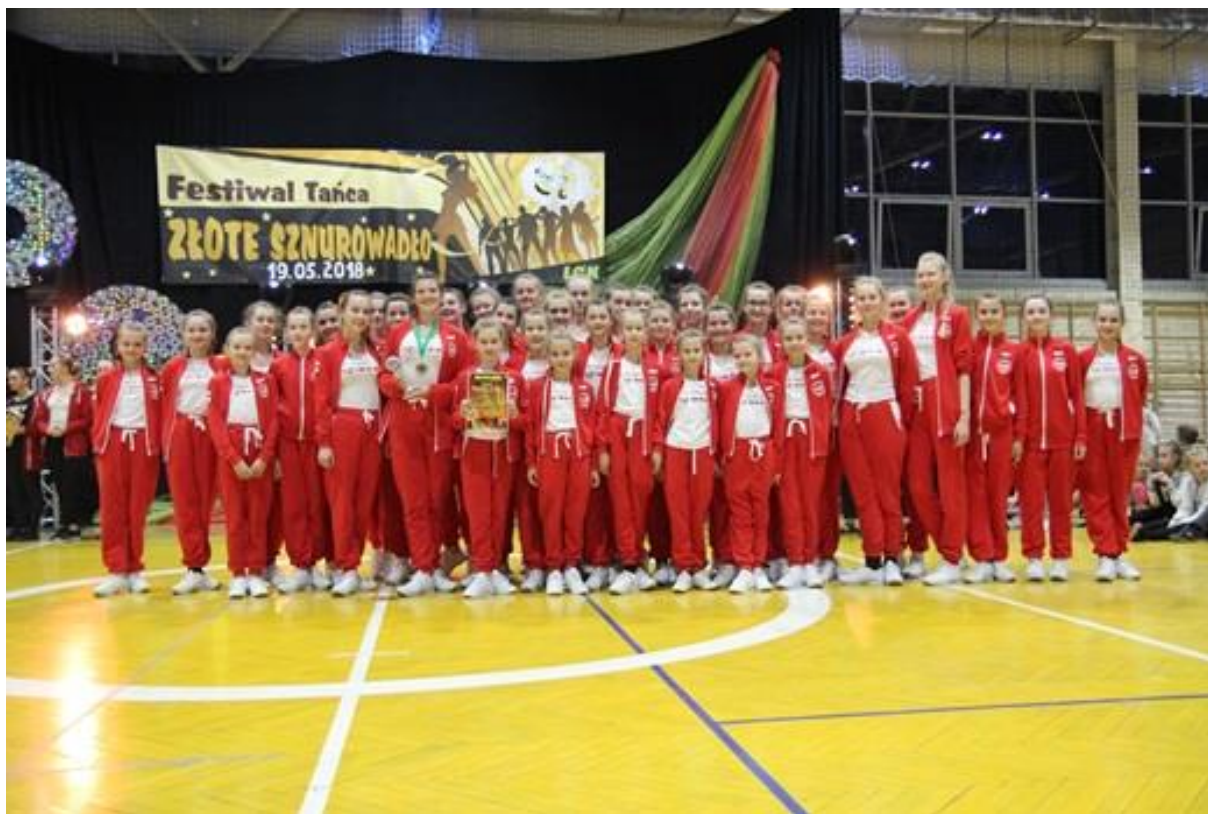
XVI. Festiwal Tańca "Złote sznurowadło"