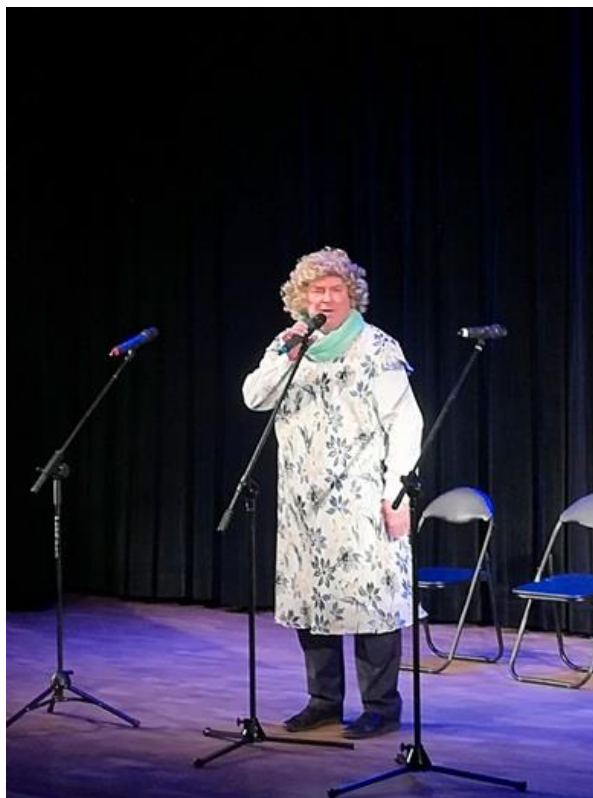
Kabaret „Koń Polski”