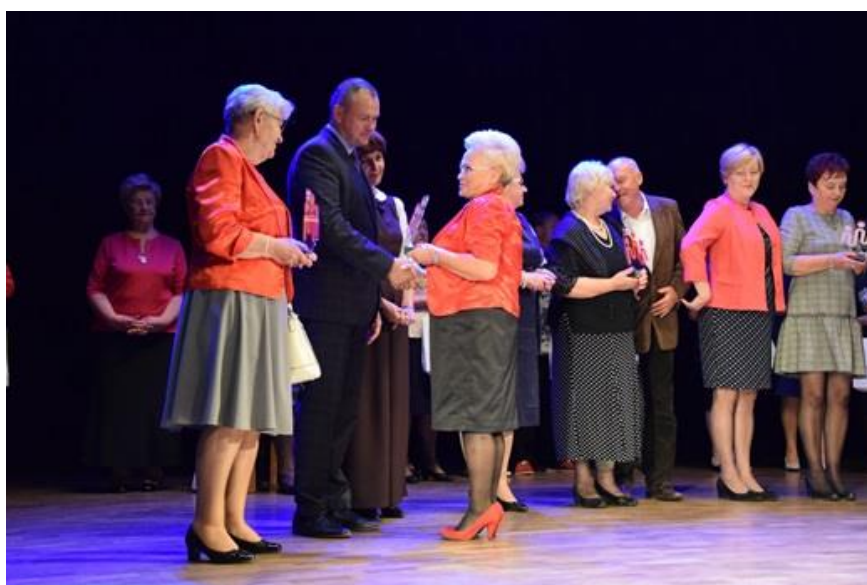
Współorganizacja gminnych imprez