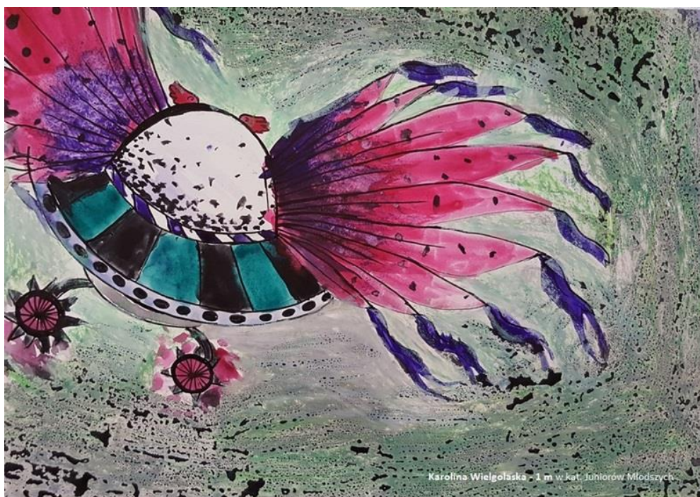
Zwycięska praca Karoliny Wielgołaski wytypowana na Konkurs Międzynarodowy FAI w Szwajcarii.