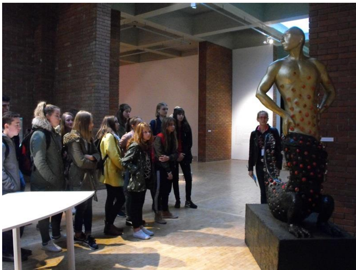
Warsztaty w Centrum Rzeźby Polskiej w Orońsku