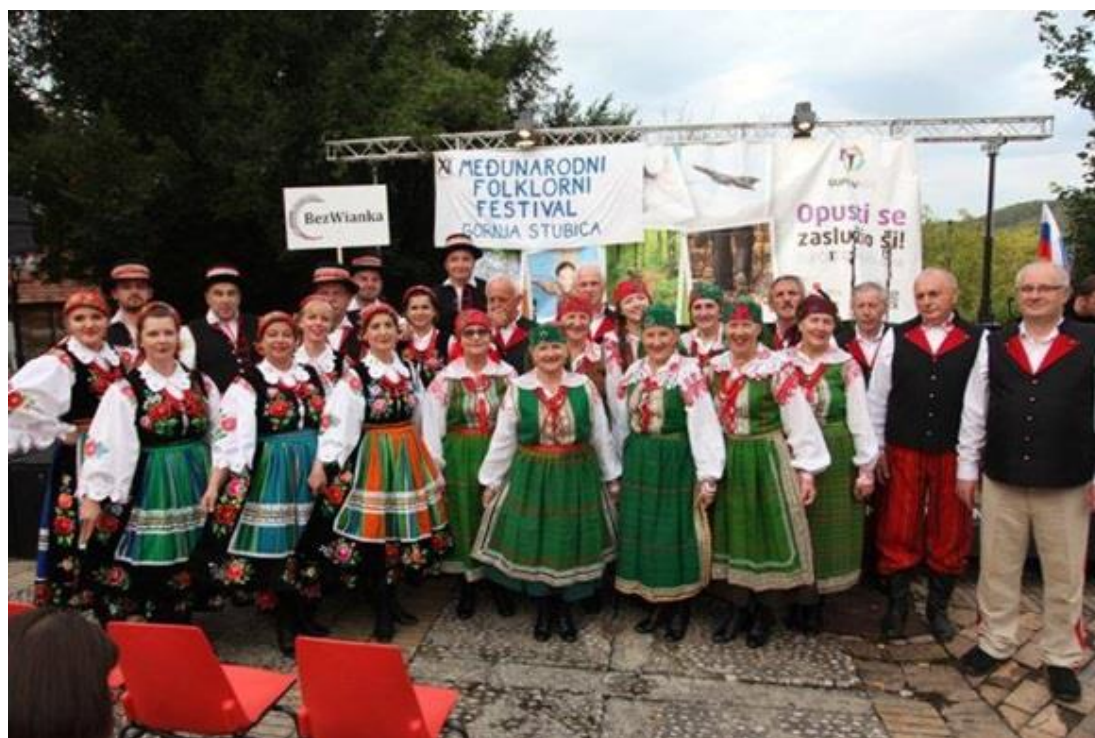
„Oberek” w Chorwacji