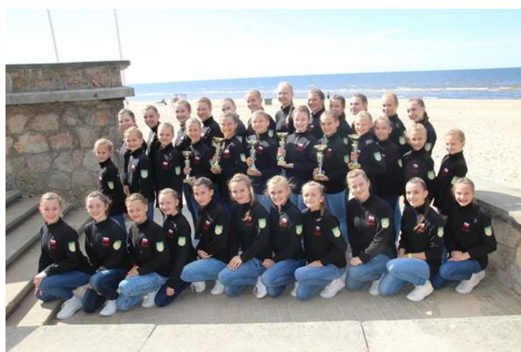
XVIII. Międzynarodowy Konkurs Tańca "Arabesk" w Jurmali (Łotwa)