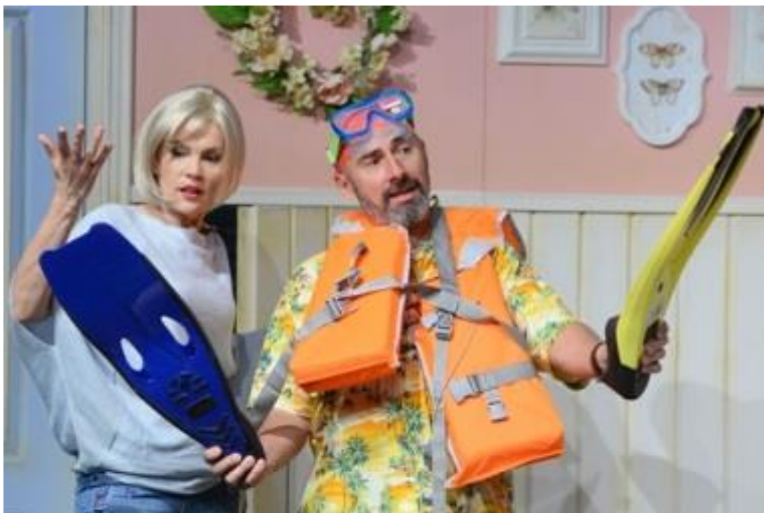
Teatr Capitol „Skok w bok”