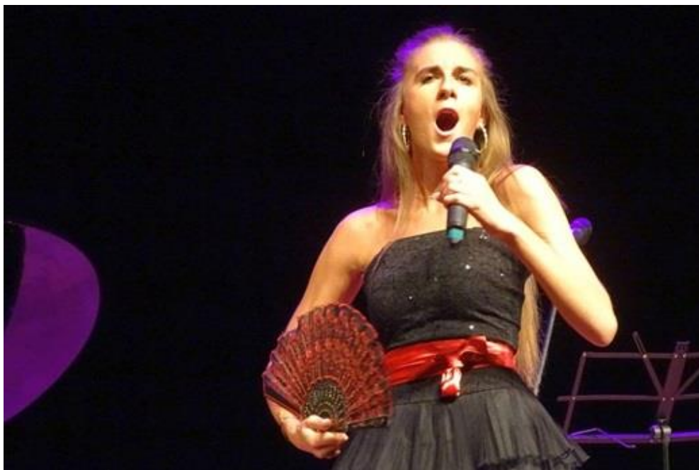
Wieczór z operą