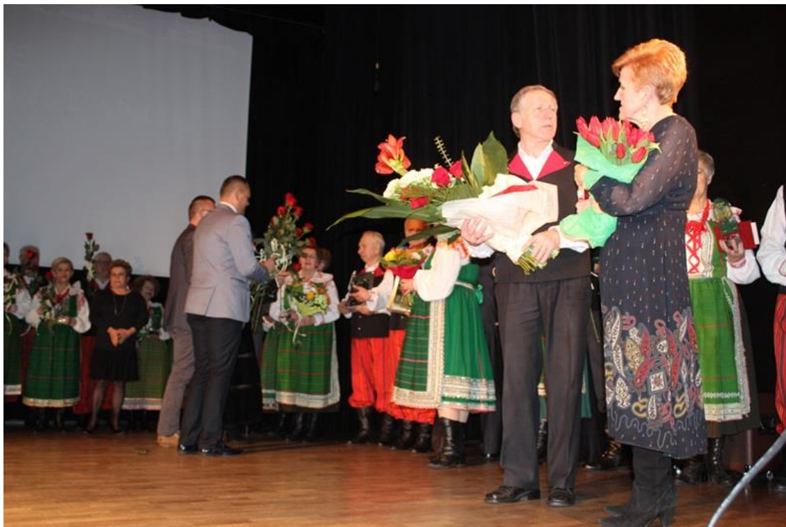
X-lecie ZPiT „Oberek”