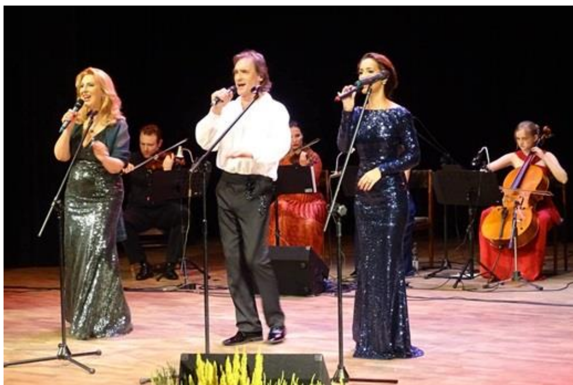
Festiwal Operowo-Operetkowy na Mazowszu