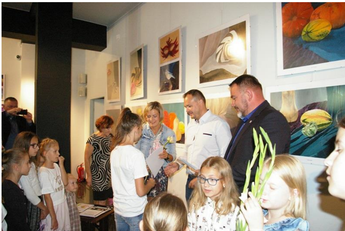
Zakończenie roku i otwarcie wystawy Koła Plastycznego