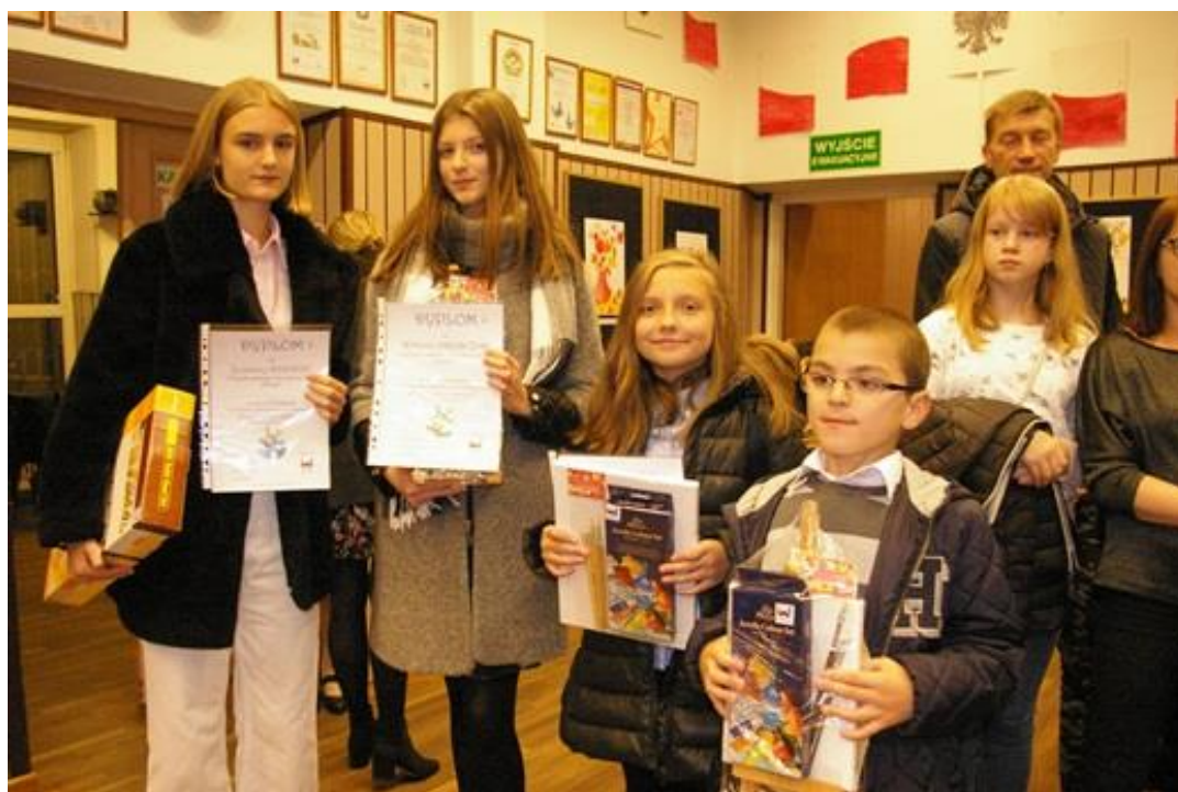
Laureaci konkursu „Pocztówka z wakacji”