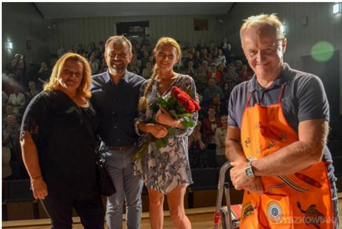
Mam Teatr „Pomoc sąiedzka”