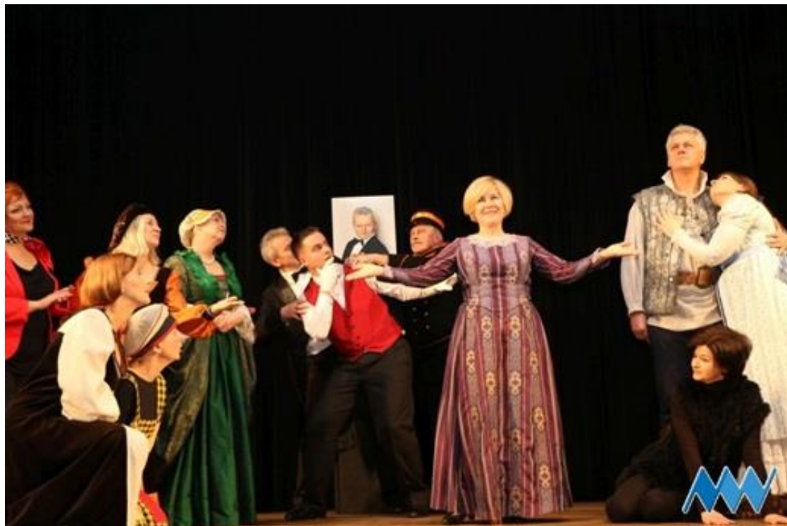
Teatr Niezbędny „Smok”