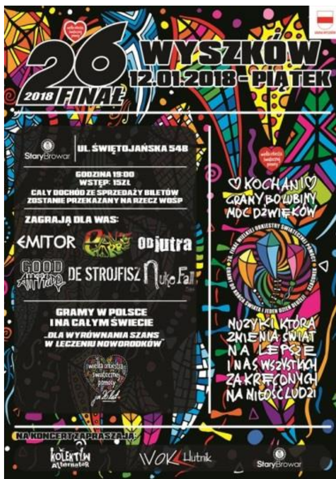
Koncert rockowy w Starym Browarze w ramach WOŚP