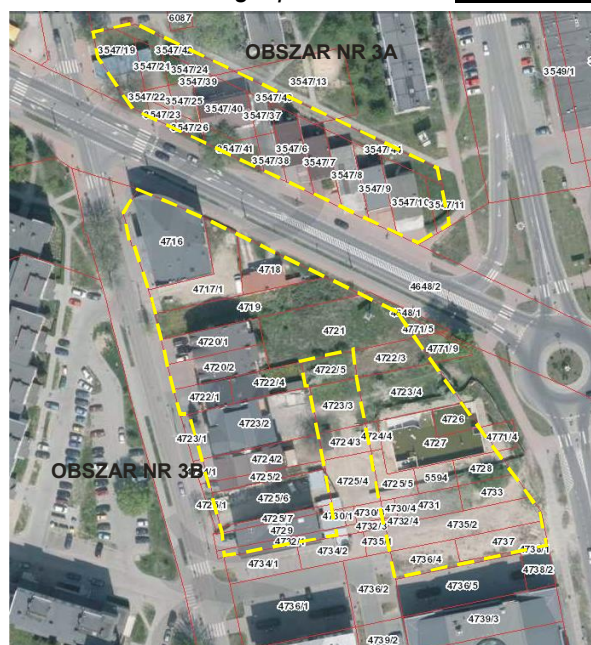
Rys. nr 3. Położenie i zagospodarowanie - obszar nr 3A i 3B