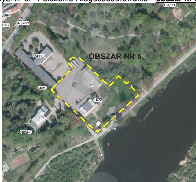
Rys. nr 5. Położenie i zagospodarowanie - obszar nr 5