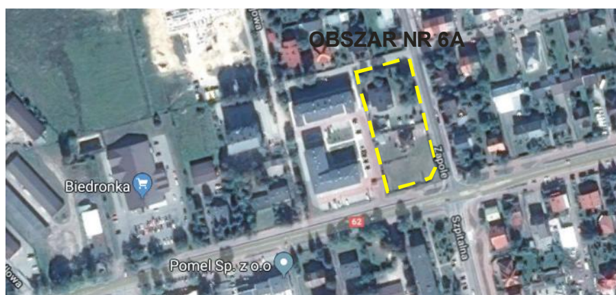
Rys. nr 6. Położenie i zagospodarowanie - obszar nr 6A

Obszar nr 6A położony jest u zbiegu ulic Zapole, Jana Kochanowskiego i Serockiej na południowym - zachodzie miasta. Jest to teren zainwestowany, w jego obrębie znajdują się dwa budynki (mieszaniowy oraz budynek, w którym oprócz funkcji mieszkaniowej prowadzona jest działalność usługowa).