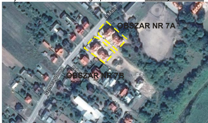
Rys. nr 10. Położenie i zagospodarowanie - obszary nr 7A i 7B

Obszary nr 7A i 7B położone są na południe od ulicy 3 – go Maja w pobliżu rzeki Bug. Jest teren zainwestowany, znajdują się tam nowo pobudowane budynki mieszkaniowe.