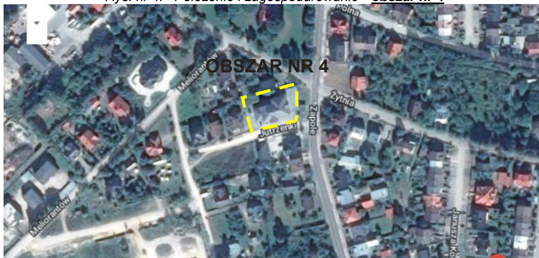
Rys. nr 4. Położenie i zagospodarowanie - obszar nr 4

Obszar nr 4 zlokalizowany jest przy ul. Jutrzenki. Jest to teren zainwestowany.