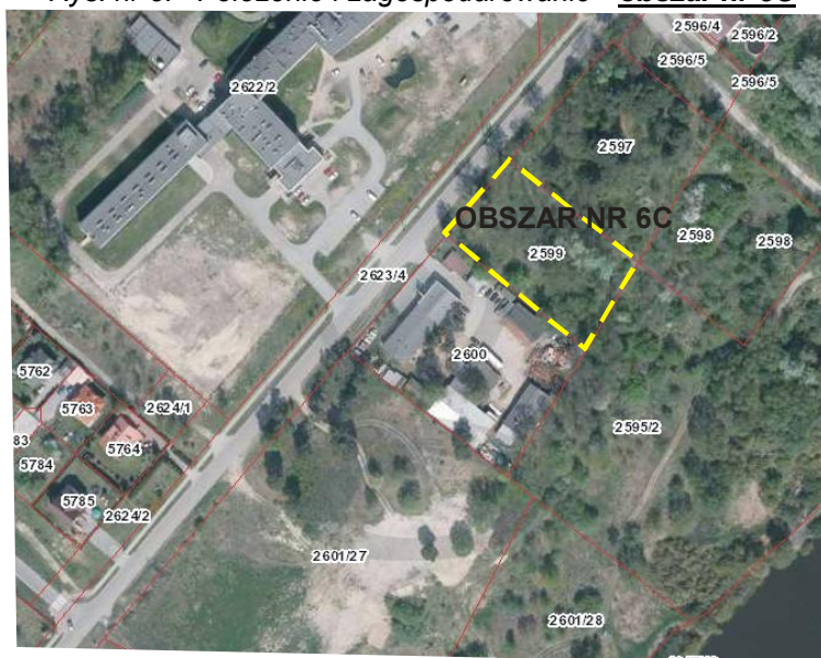
Rys. nr 8. Położenie i zagospodarowanie - obszar nr 6C

Obszar nr 6C położony jest na południe od ulicy 3 – go Maja w pobliżu rzeki Bug oraz ulicy Komisji Edukacji Narodowej. Jest to teren niezainwestowany porośnięty nieliczną roślinnością wysoką i średniowysoką. Obszar sąsiaduje głównie z terenami niezainwestowanymi jedynie od zachodu znajduje się zabudowa. Po północnej stronie ulicy 3-go Maja znajduje się Szpital Powiatowy (Samodzielny Publiczny Zespół Zakładów Opieki Zdrowotnej w Wyszkowie).