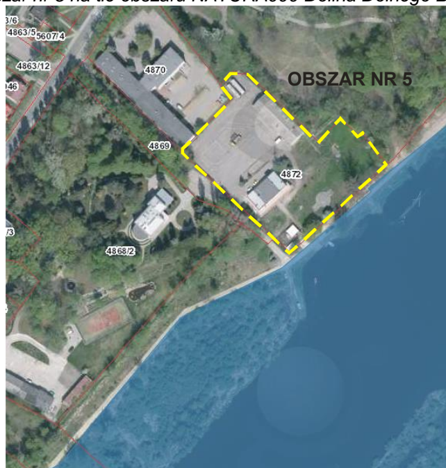
Rys. nr 12. Obszar nr 5 na tle obszaru NATURA000 Dolina Dolnego Bugu PLB 14 0001