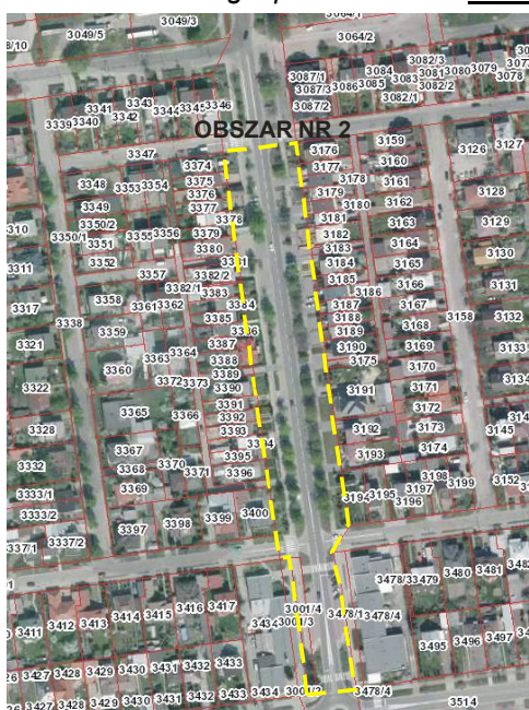
Rys. nr 2 Położenie i zagospodarowanie - obszar nr 2

Obszar nr 2 obszar obejmuje fragment ulicy Świętojańskiej na odcinku od ul. Ignacego Krasickiego do ulicy Generała Kazimierza Pułaskiego wraz z terenami do nie przyległymi. Jest to teren zainwestowany w obrębie, którego znajduje się utwardzona ulica Świętojańska (asfalt) z urządzonymi powierzchniami zielonymi porośniętymi różnorodną roślinnością wysoką oraz obustronnymi chodnikami i wjazdami do posesji wykonanymi z kostki brukowej. Obszar sąsiaduje z istniejącą zabudowa mieszkaniową.