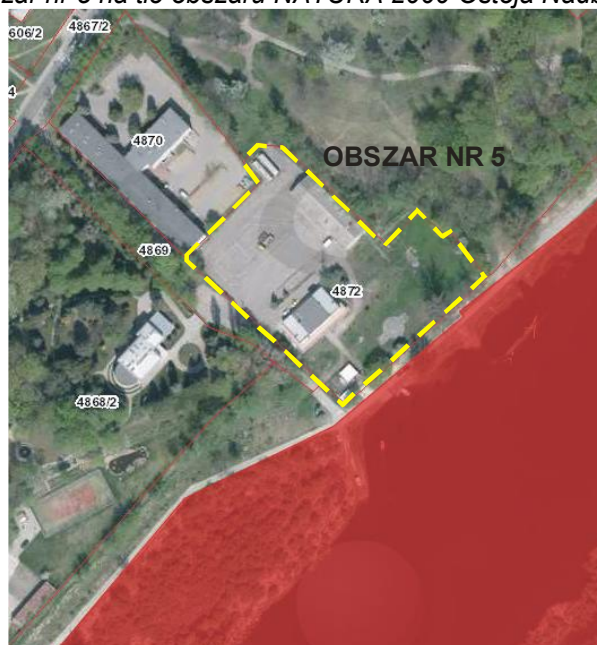
Rys. nr 15. Obszar nr 5 na tle obszaru NATURA 2000 Ostoja Nadbużańska PLH 140011