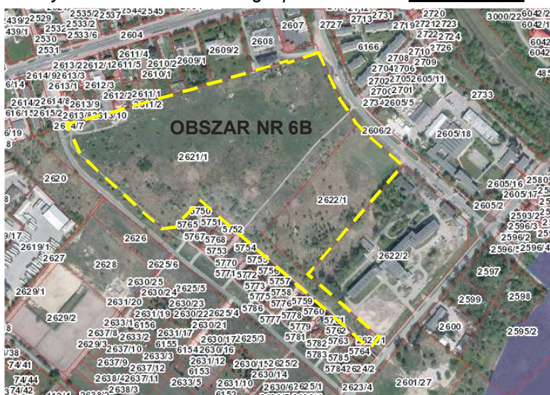
Rys. nr 7. Położenie i zagospodarowanie - obszar nr 6B