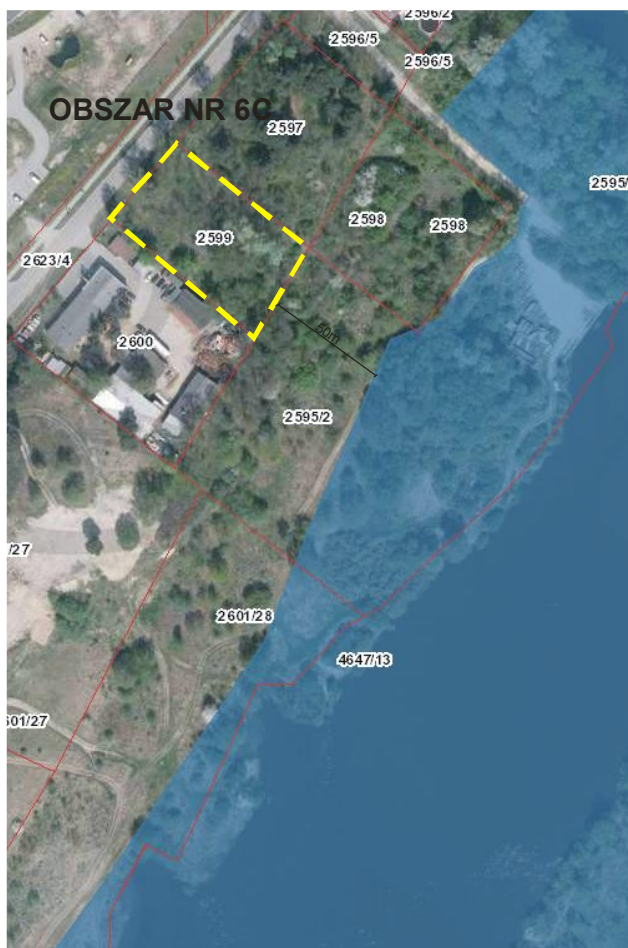
Rys. nr 13. Obszar nr 6C na tle obszaru NATURA 2000 Dolina Dolnego Bugu PLB 14 0001