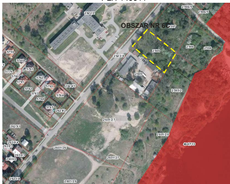
Rys. nr 16. Obszar nr 6C na tle obszaru NATURA 2000 Ostoja Nadbużańska PLH 140011