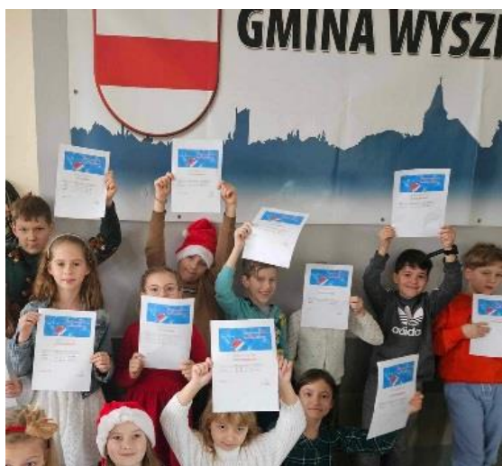
Moving w minisiatkówce dziewcząt i chłopców.

Ad. 1 Uczniowski Klub Sportowy Polonez – prowadzona od wielu lat z sukcesami sekcja pływania i siatkówki UKS Polonez Wyszków reprezentuje Gminę na arenie krajowej w licznych zawodach pływackich i siatkarskich. W 2023 roku w 5 startach na zawodach wzięło udział ponad 300 zawodników UKS Polonez Wyszków (zawody w Mławie, Giżycku, Warszawie, Ostrołęce i w Wyszkanie). Zdobyte medalowe padają łupem młodych pływaków z Wyszkania niemal na każdych zawodach sportowych. W 2023 roku zawodnicy UKS Polonez Wyszków wzięli udział również w Mistrzostwach Mazowsza młodzików i młodziczek – rozgrywki MWZPS oraz Mistrzostwach Kinder Joy of